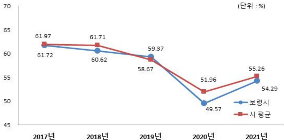
유형 지방자치단체와 재정자주도 비교